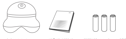
mini339 Relaxer 사용자 설명서 건전지(AAA size 3개입)

mini339 Relaxer, 사용자 설명서, 건전지(AAA size 3개입)